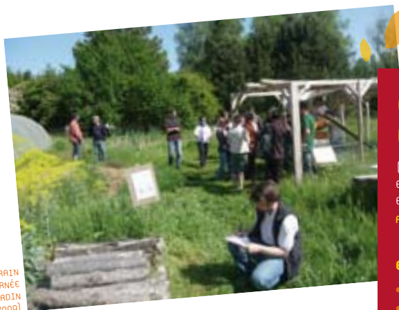
SUR LE TERRAIN LORS D'UNE JOURNÉE THÉMATIQUE JARDIN (24 AVRIL 2009)

Tous sont parties prenantes du réseau et acteurs d'une dynamique d'échanges et de réflexion visant à développer et à promouvoir l'éducation à l'environnement dans la région Rhône-Alpes et l'ensemble de ses territoires.