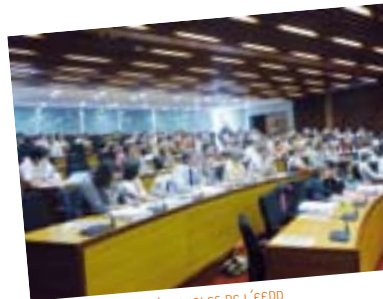
LORS DES ASSISES RÉGIONALES DE L'EEDD AU CONSEIL RÉGIONAL (13 JUIN 2009)

Les 8 es Rencontres Régionales seront organisées début décembre : la thématique et le lieu sont encore à préciser!